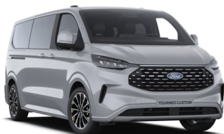
Grey Matter (тільки для Titanium / Titanium X)