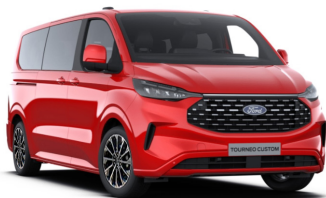
Race Red (тільки для Trend)