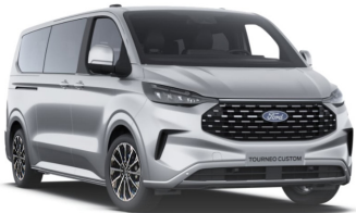
Moon dust Silver