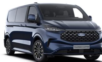
Blazer Blue тільки для Trend