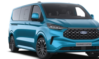
Digital Aqua Blue (тільки для Titanium / Titanium X)