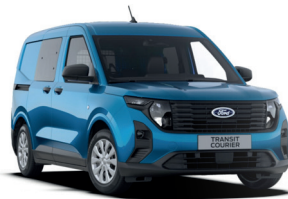
Digital Aqua Blue