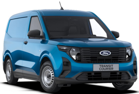
Digital Aqua Blue