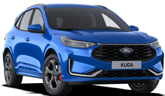
Desert Island Blue*