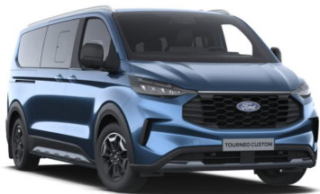
Blue metallic/Chrome Blue