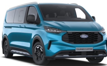
Digital Aqua Blue