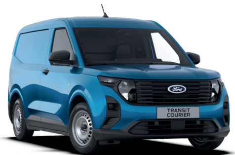
Digital Aqua Blue