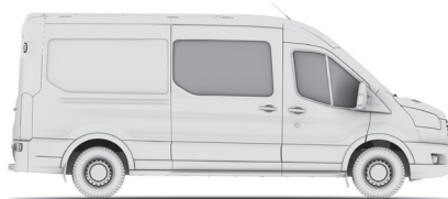
DOUBLE CAB IN VAN L3H2

Kombi – багатощільовий, 9 місць DC IN VAN (Double Cab in Van) – фургон, 6 місць LWB (Long Wheel Base- L3) – довга колісна база H2 – середній дах FWD – привод на передню вісь