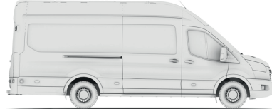
VAN L4H3 (JUMBO 350/470)

VAN - вантажний фургон MWB (Medium Wheel Base - L2) - середня колісна база LWB (Long Wheel Base - L3) - довга колісна база LWB EF (Long Wheel Base Extended Frame - L4 (Jumbo)) - довга колісна база з подовженим кузовом H2 - середній дах, H3 - високий дах RWD - привод на задню вісь