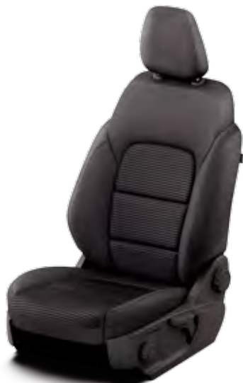
Тканина чорного кольору (Titanium, Titanium Plus)