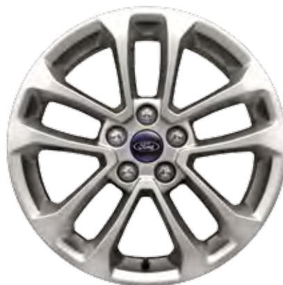
Колісні диски легкосплавні, шини 225/65 R17 (Titanium, Titanium Plus)