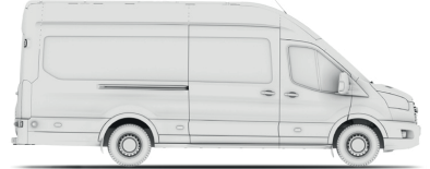
VAN L4H3 (JUMBO 350/470)

VAN - вантажний фургон MWB (Medium Wheel Base - L2) - середня колісна база LWB (Long Wheel Base - L3) - довга колісна база LWB EF (Long Wheel Base Extended Frame - L4 (Jumbo)) - довга колісна база з подовженим кузовом H2 - середній дах, H3 - високий дах RWD - привод на задню вісь