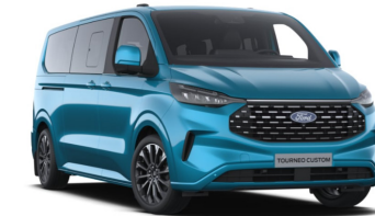
Digital Aqua Blue (тільки для Titanium / Titanium X)