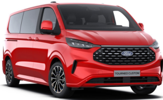
Race Red (тільки для Trend)