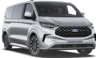
Moon dust Silver