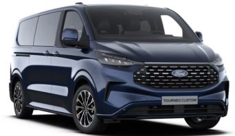
Blazer Blue тільки для Trend