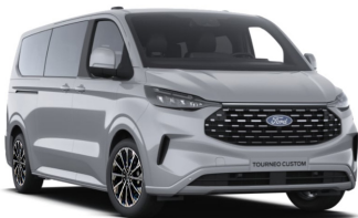
Grey Matter (тільки для Titanium / Titanium X)