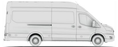
VAN L4H3 (JUMBO 350/470)

VAN - вантажний фургон MWB (Medium Wheel Base - L2) - середня колісна база LWB (Long Wheel Base - L3) - довга колісна база LWB EF (Long Wheel Base Extended Frame - L4 (Jumbo)) - довга колісна база з подовженням кузовом H2 - середній дах, H3 - високий дах RWD - привод на задню вісь